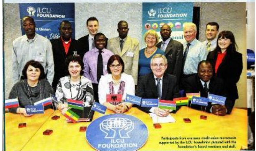
Participants from overseas credit union movements supported by the ILCU Foundation gathered with the Foundation's Board members and staff.

The UN General Assembly declared 2012 as the International Year of Cooperatives. The theme for the year is "Cooperative Enterprises Build a Better World" and the objective was to "highlight the contribution of cooperatives to socio-economic development, particularly their impact on poverty reduction, employment generation and social integration". In line with this worldwide celebration of cooperatives the Foundation held its inaugural International Partners Conference and Workshop in February.