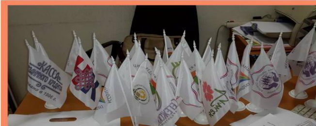
Программа единого фирменного стиля для КПК